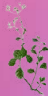
หญ้าดอกขาว Leptochloa chinensis Nees