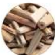
TCDC Material DATA