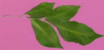
โปรงฟ้า Andaman satinwood.