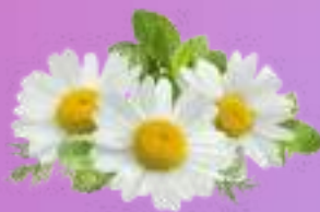
คาโมมายด์ Camomile