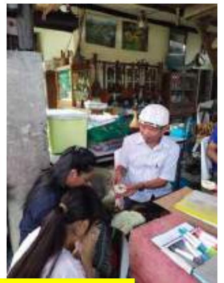
การประชุมวางแผนการดำเนินโครงการร่วมกับชาวบ้านปราชญ์ชาวบ้านกองตี่มีศิลป์