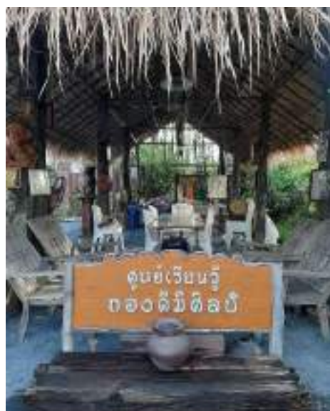
การลงพื้นที่ประชาสัมพันธ์โครงการร่วมกับเครือข่ายชุมชนสันกำแพง สำนักวัฒนธรรมจังหวัดเชียงใหม่ องค์การบริหารส่วนตำบลสันกำแพง และองค์การบริหารส่วนจังหวัดเชียงใหม่