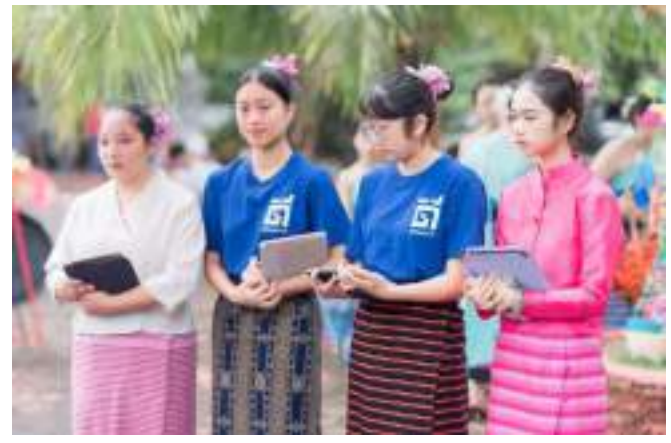
การจัดกิจกรรมอบรมเรียนรู้ภูมิปัญญาท้องถิ่นมีศิลป์ แกนนำเยาวชนจาก ๑๔ หมู่บ้านได้มาเข้าร่วมกิจกรรมการให้ความรู้เกี่ยวกับภูมิปัญญาท้องถิ่นของชุมชนท้องถิ่นมีศิลป์ ณ โสภะเฮียนสืบสานทางวัฒนธรรม อำเภอเมือง จังหวัดเชียงใหม่