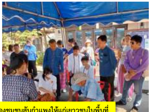
การลงพื้นที่เรียนรู้และเผยแพร่ภูมิปัญญาของชุมชนต้นกำเนิดให้แก่เยาวชนในพื้นที่