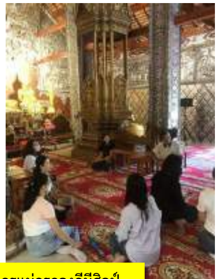
การลงพื้นที่สำรวจชุมชนบ้านสันกำแพงและประชุมร่วมกับพ่อครูแม่ครูกองดีมีศิลป์