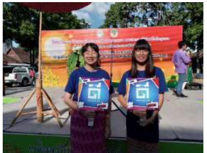
การลงพื้นที่เรียนรู้และเผยแพร่ภูมิปัญญาของชุมชนสันกำแพงให้แก่เยาวชนในพื้นที่