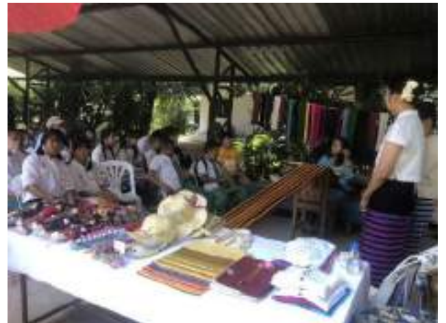
การจัดกิจกรรมอบรมเรียนรู้ภูมิปัญญาท้องถิ่นศิลป แกนนำเยาวชนจาก ๑๔ หมู่บ้านได้มาเข้าร่วมกิจกรรมการให้ความรู้เกี่ยวกับภูมิปัญญาท้องถิ่นของชุมชนท้องถิ่นศิลป ณ โฮงเฮียนสืบสานทางวัฒนธรรม อำเภอเมือง จังหวัดเชียงใหม่