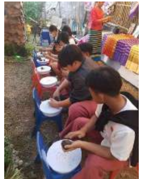
การจัดกิจกรรมอบรมเรียนรู้ภูมิปัญญาของดีมีศิลป์ แก่นนำเยาวชนจาก ๑๔ หมู่บ้านได้มาเข้าร่วมกิจกรรมการให้ความรู้เกี่ยวกับภูมิปัญญาท้องถิ่นของชุมชนของดีมีศิลป์ ณ โสภะเฮียนสืบสานทางวัฒนธรรม อำเภอเมือง จังหวัดเชียงใหม่