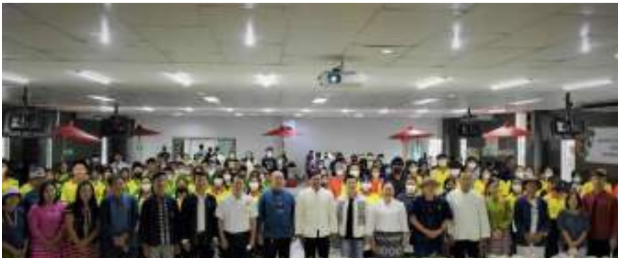
การลงพื้นที่ประชาสัมพันธ์โครงการและได้รับความอนุเคราะห์จากนายภิญโญ พัวศรีพันธุ์ นายอำเภอสนักำแพง สนับสนุนการดำเนินโครงการและกิจกรรมการลงพื้นที่ของทีมก้าวหน้าเมืองศิลป์