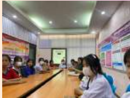
ประชุม ชักซ้อมและเตรียมความพร้อมสำหรับการลงพื้นที่