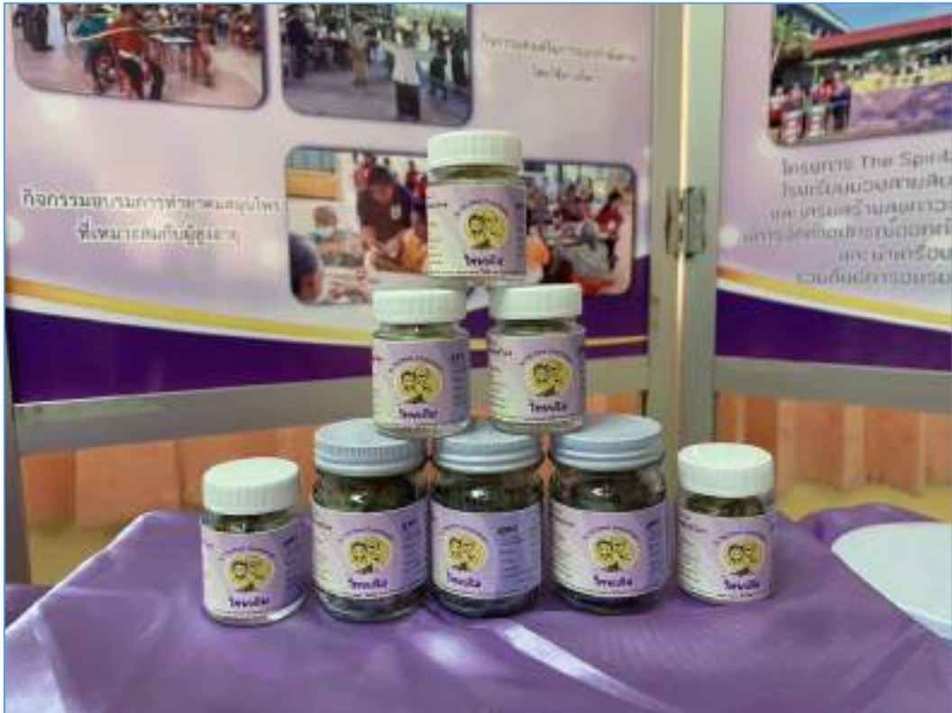
ผลิตภัณฑ์ยาต้ม “ไทยเดิม” ผลิตโดยผู้สูงอายุที่เข้าร่วมโครงการและทีม The Real Amphawan โรงเรียนม่วงสามสิบอัมพวันวิทยา