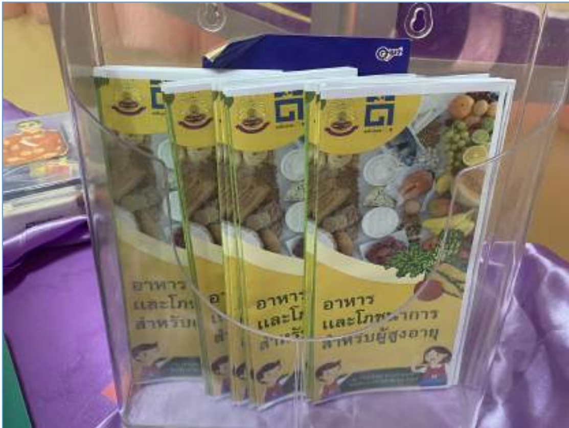
แผ่นพับความรู้ อาหารและโภชนาการสำหรับผู้สูงอายุ โดยทีม The Real Amphawan โรงเรียนม่วงสามสิบอัมพวันวิทยา