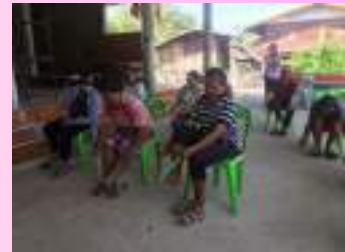
ภาพบรรยากาศการลงพื้นที่กลุ่มย่อย