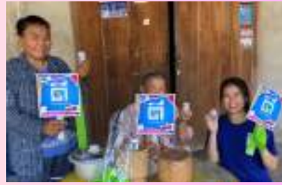
ภาพบรรยากาศการลงพื้นที่กลุ่มย่อย