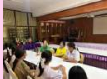
ประชุมวางแผนการดำเนินโครงการ