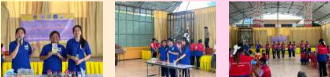
ลงพื้นที่ บ้านหนองหลัก ณ วัดหนองหลัก