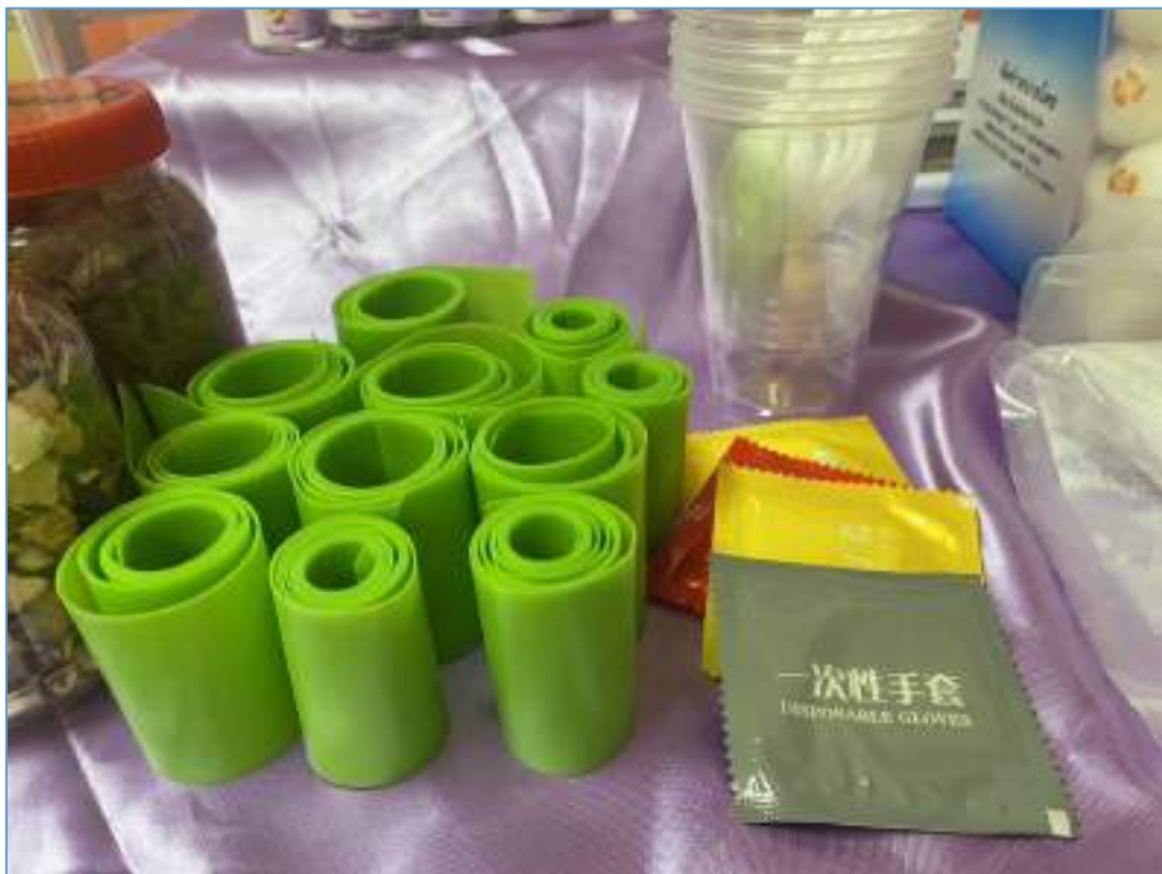
ยางยืดที่ให้ผู้สูงอายุในโครงการใช้ในการออกกำลังกายโดยใช้อุปกรณ์