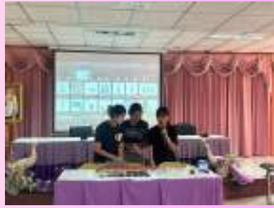
อบรมสมาชิกในโครงการเกี่ยวกับการทำยาตามสมุนไพร