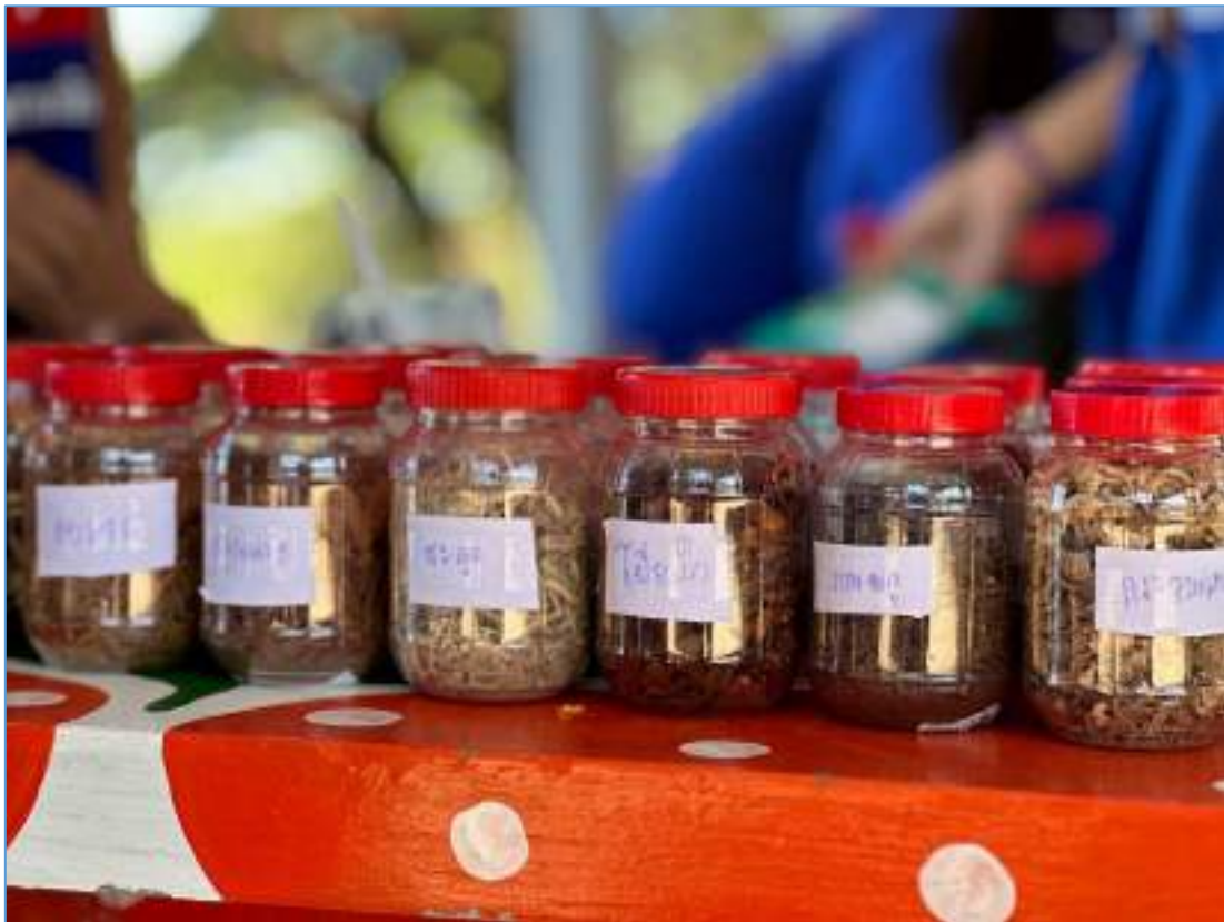
สมุนไพรที่นำมาใช้ในการผลิตยาผสมสมุนไพร