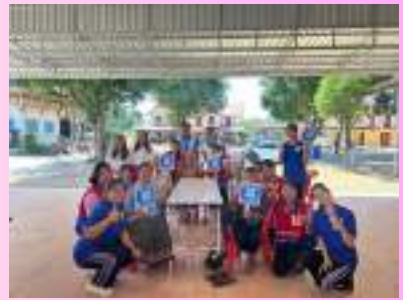
ลงพื้นที่ บ้านหนองหลัก ณ วัดหนองหลัก