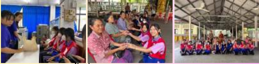
ลงพื้นที่ บ้านหนองขุน ณ วัดหนองขุน