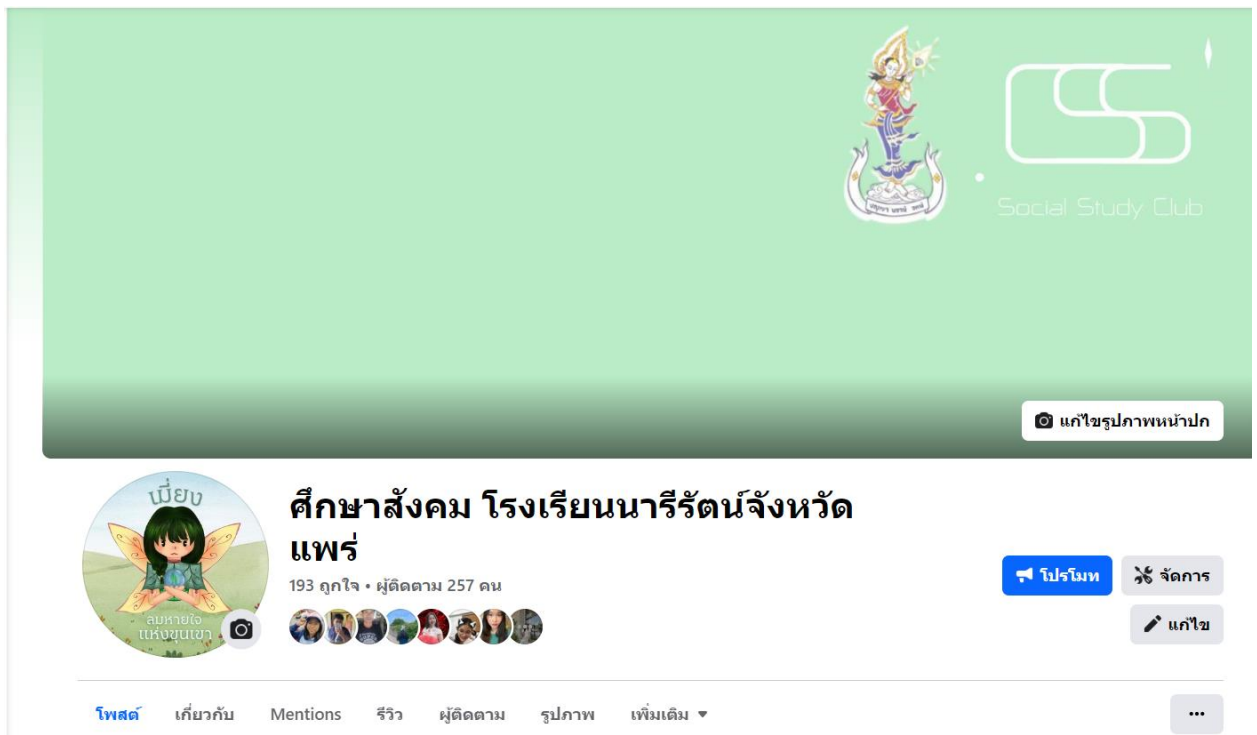
ช่องทางติดตามและรับชมการดำเนินโครงการ