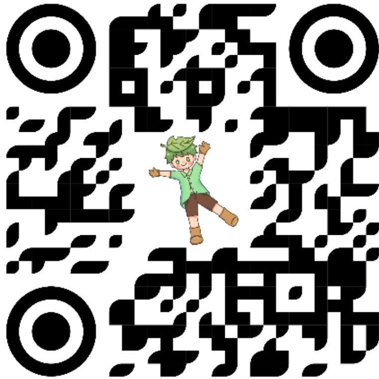
ภาพการดำเนินโครงการ