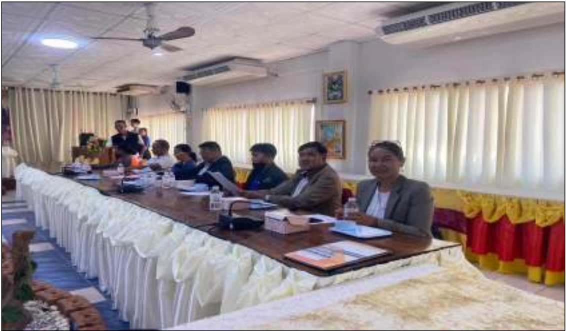
ภาพตัวอย่างกิจกรรมที่ ๓ การประชุมผู้นำชุมชนทั้ง ๑๓ หมู่บ้าน