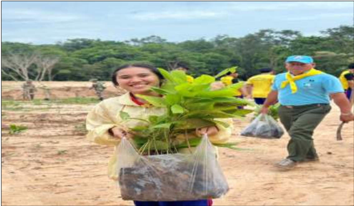
ภาพตัวอย่างกิจกรรมที่ ๒ การปลูกป่า