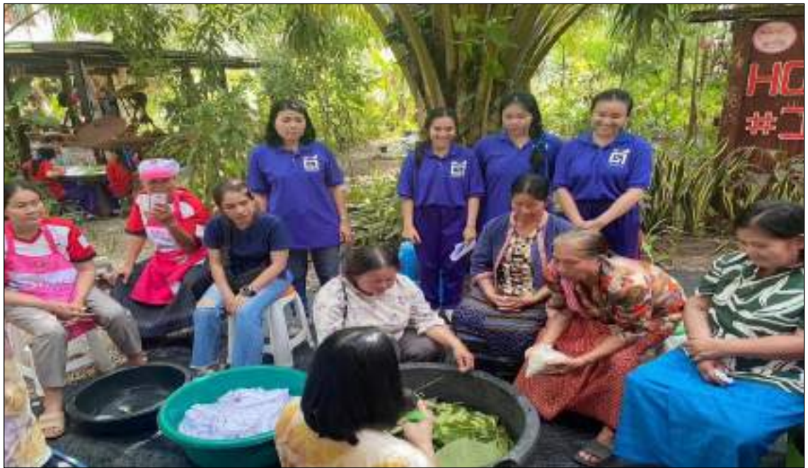
ภาพตัวอย่างกิจกรรมที่ ๑ การทำเสื้อพิมพ์ลายจากสีธรรมชาติ ECO-PRINT